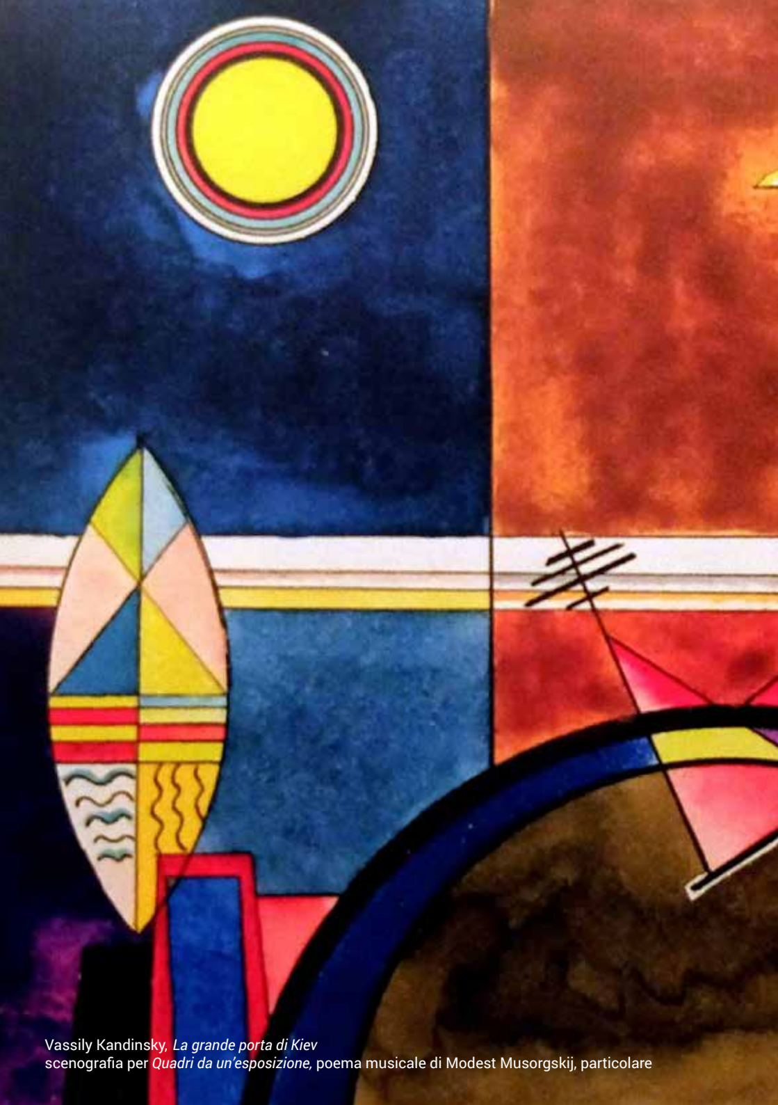
Vassily Kandinsky, La grande porta di Kiev scenografia per Quadri da un'esposizione , poema musicale di Modest Musorgskij, particolare