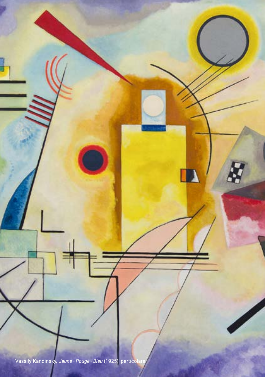
Vassily Kandinsky, Jaune - Rouge - Bleu (1925), particolare