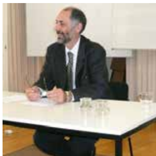
Giorgio Sanguinetti "La forma-sonata: nuove prospettive di analisi"