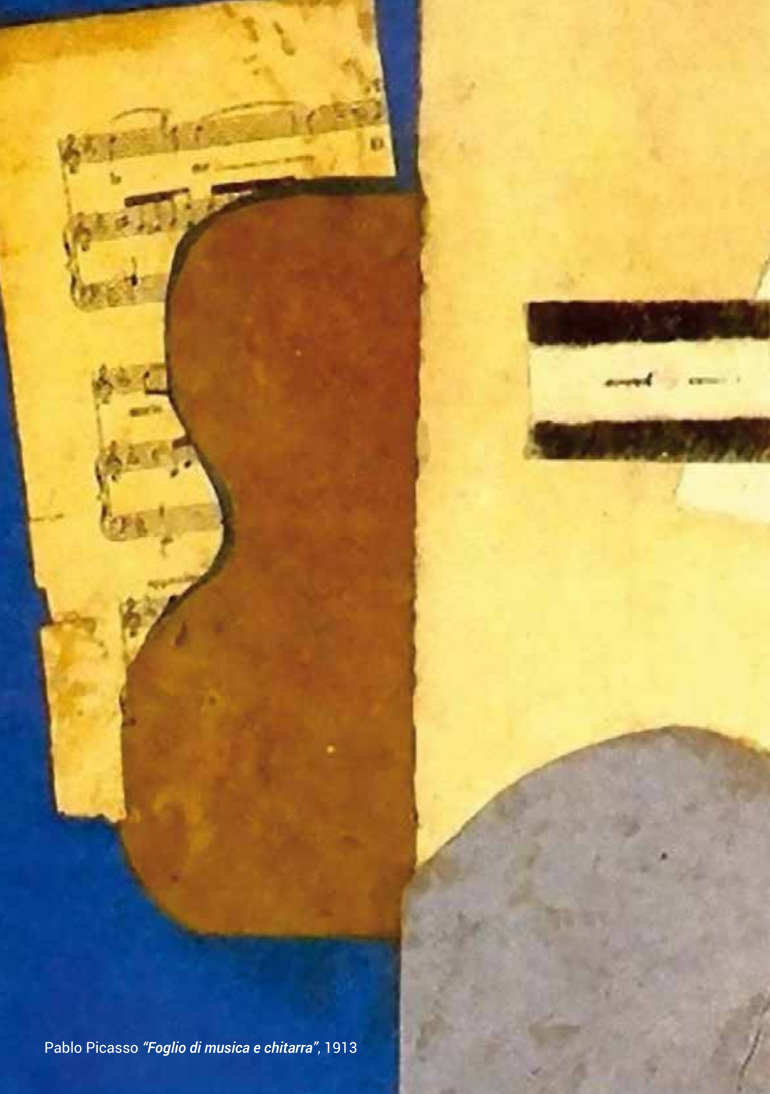
Pablo Picasso "Foglio di musica e chitarra", 1913