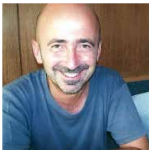
Luciano Massi "La personalità artistica di Beethoven come emerge dall'analisi della sua scrittura"