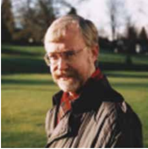
Barry Truax “Composizione musicale elettroacustica”